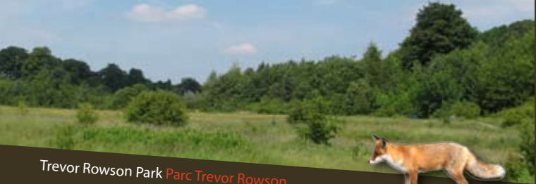
Trevor Rowson Park Parc Trevor Rowson