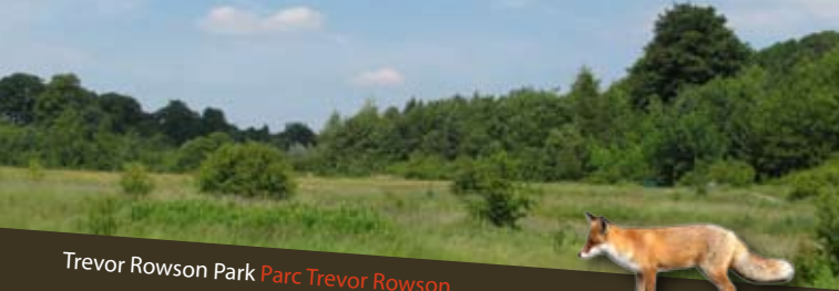
Trevor Rowson Park Parc Trevor Rowson